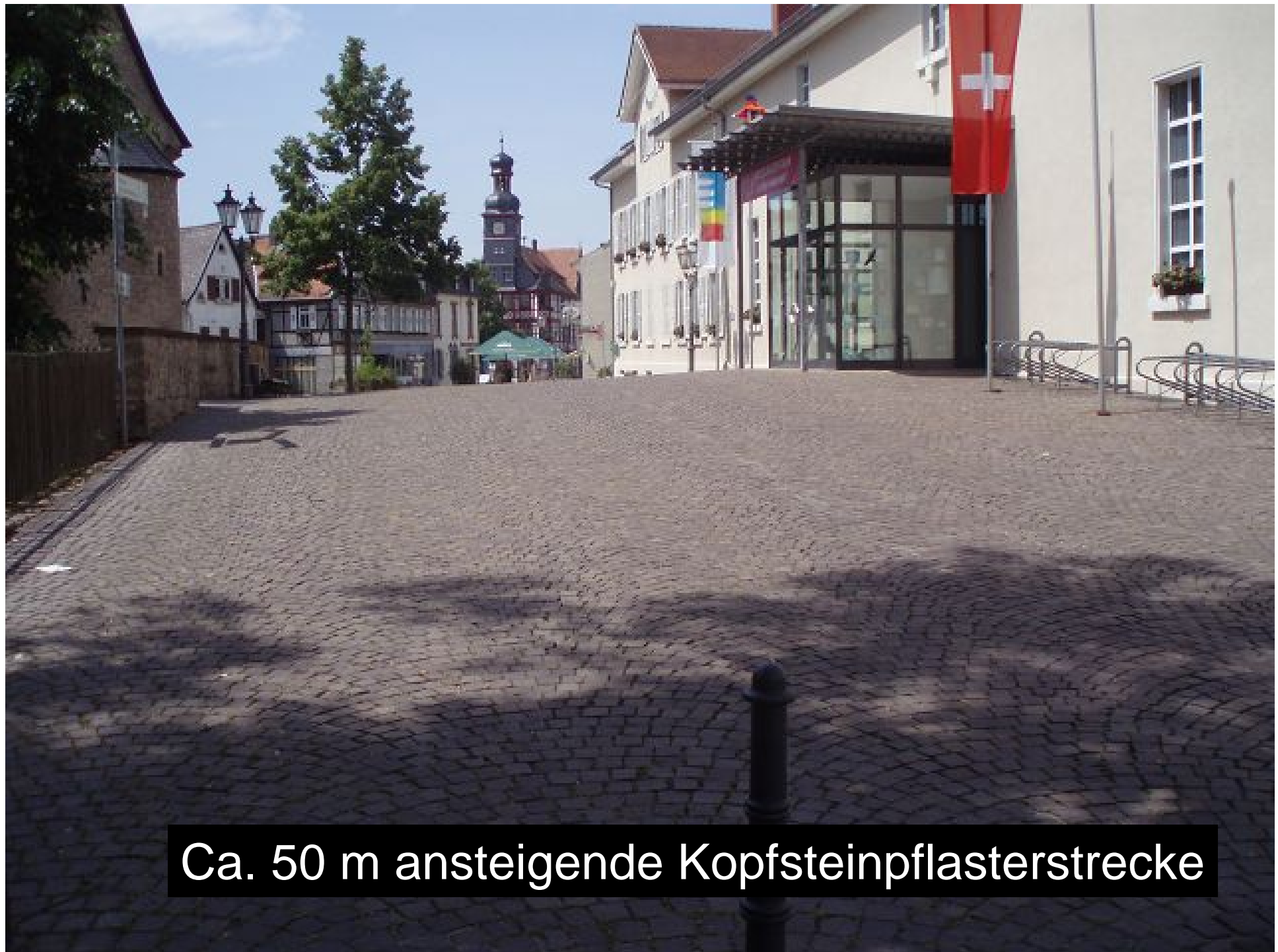
Ca. 50 m ansteigende Kopfsteinpflasterstrecke